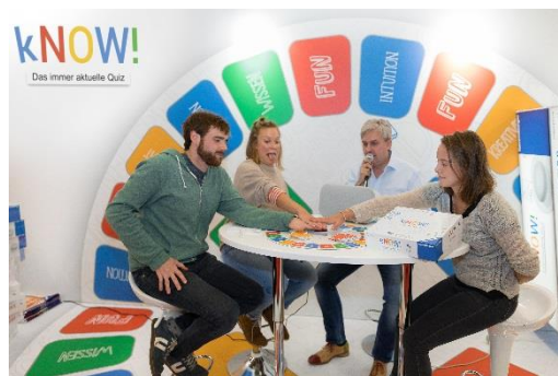
kNOW! ist das erste Gesellschaftsspiel, das zusammen mit Google entwickelt wurde.

Essen/Ravensburg, 24. Oktober 2018 – Ein immer aktuelles Quiz dank digitalem Sprachassistenten von Google und ein Wettlauf mit echten Eiswürfeln: Ravensburger zeigt auf der diesjährigen Neuheitenschau der weltgrößten Publikumsmesse für Gesellschaftsspiele Spiel '18 in Essen innovative Spielideen. Bei „kNOW!“ kommen Fragen ins Spiel, die es so noch nie in einem Quizspiel gab: Denn die Antworten auf viele der über 1.500 Fragen wechseln täglich – und je nachdem, wo man spielt. Bei „Cool Runnings“ gilt es, seinen Eiswürfel als Erster über die Ziellinie oder die anderen zum Schmelzen zu bringen. Eine Fachjury hat diese originelle Spielidee heute mit dem Innovationspreis „innoSPIEL 2018“ ausgezeichnet.